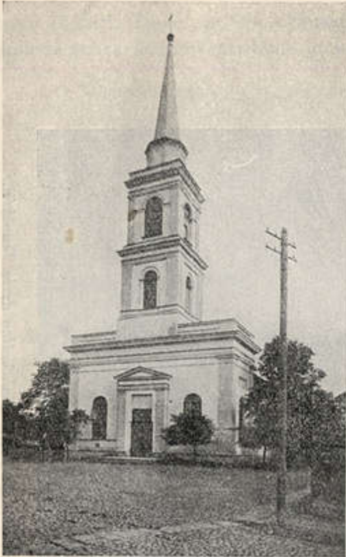
89. joon. Tartu Maarja kirik.

Maarja kirik ( Eglise de la Sainte Vierge ).