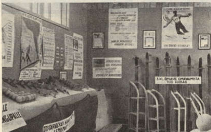
Õpilaste omavalmistatud suusad.

nud võimlast tolmu kõrvaldamise vahendid, ebatervishoidlikud ja tervishoidlikud joogivee-abinõud, kätepesemis-vahendid, samuti esines rõivaid ja tööpõll, toakingad koolis kandmiseks, tabelleid ja diagramme